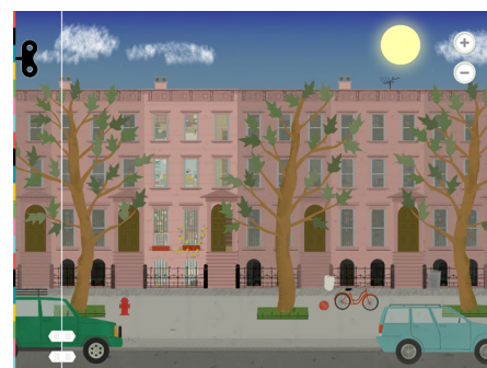
ДОМА БЛОЧНОЙ ЗАСТРОЙКИ В США

Дети могут готовить еду, ремонтировать и украшать дома, а также играть в различные игры. Благодаря функциям и возможностям для устройств iOS, дети погружаются в игру "с головой". Камера позволяет детям разглядывать себя в зеркалах, а также выбирать фотографии, чтобы вставлять их в рамки в разных домах и чувствовать себя "дома".