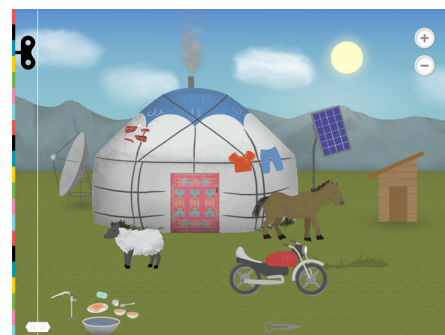
ЮРТА В МОНГОЛИИ