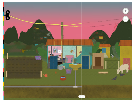
САМАНЫЙ ДОМ В ГВАТЕМАЛЕ