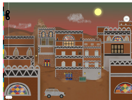
БАШНЯ-ДОМ В ЙЕМЕНЕ