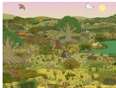
Умеренный луга (скоро в продаже)