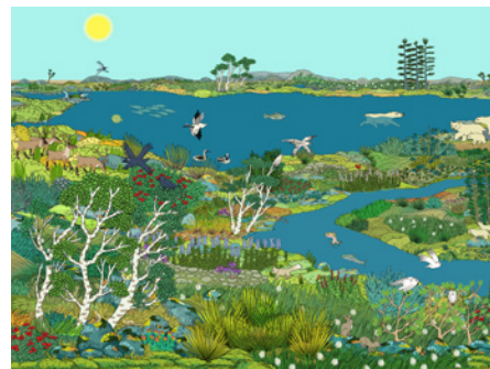
Тундра (скоро в продаже)